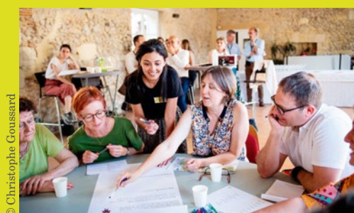
Atelier participatif du 17 mai 2022, secteur La Clairière-Ermitage.

Les ateliers à venir permettront d'aborder les questions spécifiques à chaque secteur, afin de prendre en compte l'avis des Gradignanaïses et Gradignanaïses.